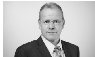
Dr. med. Jürg Schlup Ehemaliger Präsident Verbindung der Schweizer Ärztinnen und Ärzte FMH